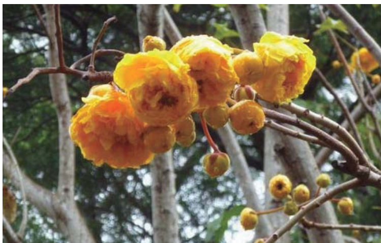
Tema 2012: Flora Brasileira Algodão do Cerrado ( Cochlospermum vitifolium )