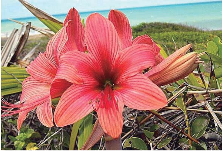
Tema 2012: Flora Brasileira Açucena ( Hippeastrum stylosum )